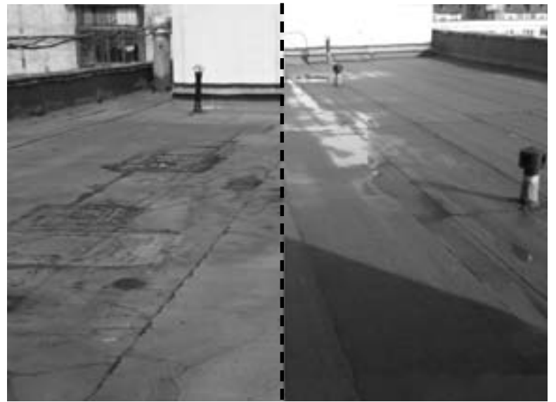
Крыша дома № 55, к. 3 по Московскому шоссе до...

– Нет, не упразднило. ТСЖ будет выполнять функции управляющей компании. ТОС и работающий на основании его устава домовый комитет мы попросим помогать нам в обустройстве придомовой территории, детской площадки, следить за чистотой в подъездах, проводить дворовые