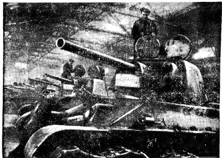
Н-ский завод на Урале. Сборка танков.

детских сада, 10 бань и т. д. Во втором полугодии 1943 года жилищное строительство в угольных бассейнах примет еще более широкий размах.